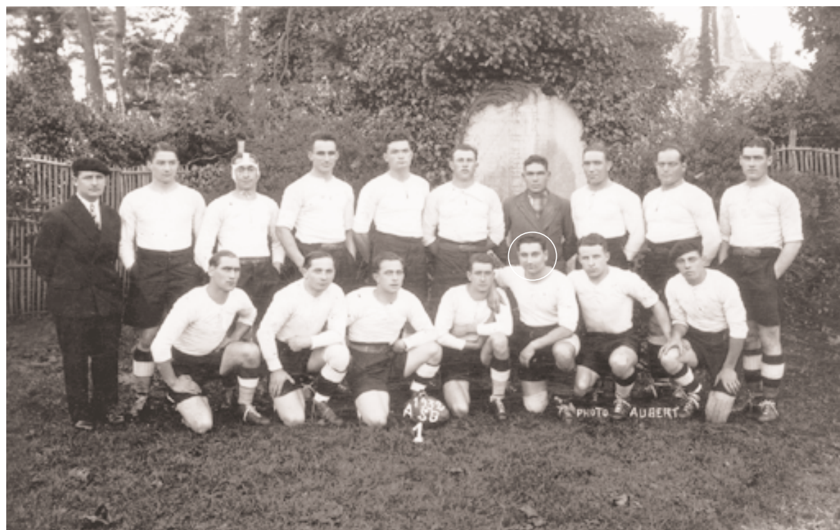
L'équipe "blanc et noir" de l'A.S.B. 1932-33 :