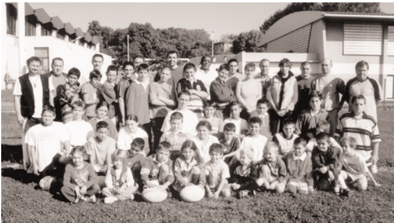
L'École de Rugby 2004-2005.

Sans oublier tous les bénévoles et les parents qui nous accompagnent toute la saison.