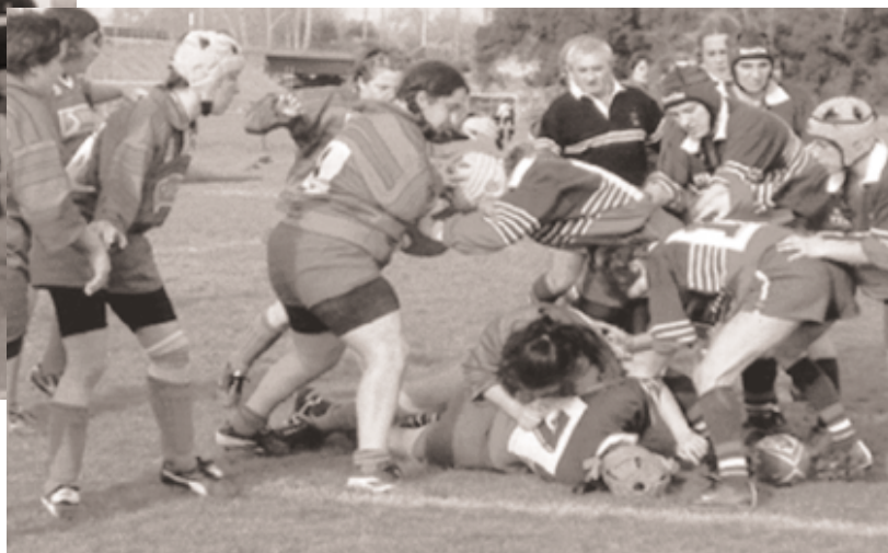
Une action dominatrice des avants de l'A.S.B.